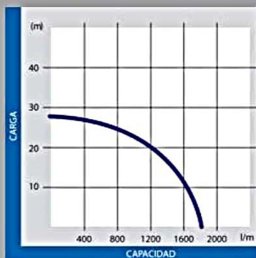
WT40XK2: 4" x 4"