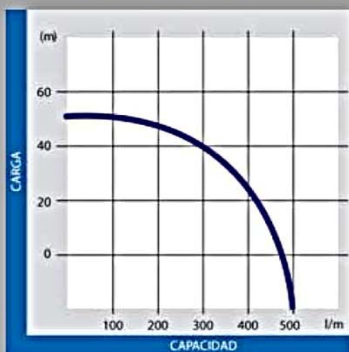
WH20XK1: 2" x 2"