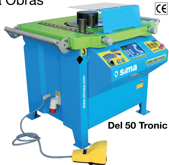
Del 50 Tronic