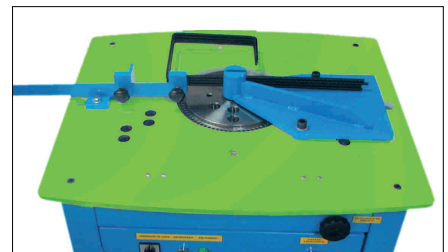
ESTRIBOS POLIGONALES (Opcional)

Indispensable para armar pilares circulares, columnas y encofrados circulares especiales.